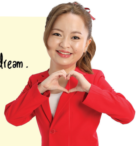
พื้แนนนั